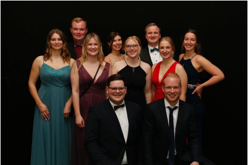
Der neue Vorstand, Januar 2023